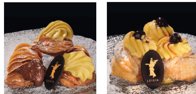
ARAGOSTINE Crème, nutella, et pistache 11.00 ZEPPOLINE DI SAN GIUSEPPE Dessert Napolitain, frit et farci à la crème "Luigia" avec des cerises noires (amarene) 11.00