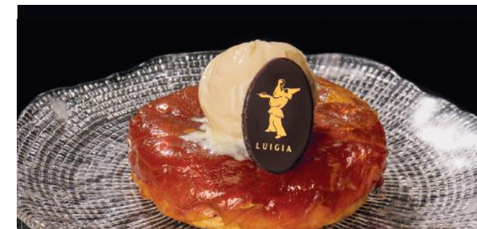
TARTE TATIN 12.00 Avec glace maison à la crème et aux œufs