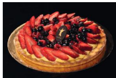
CROSTATA DI FRUTTA Tarte aux fruits