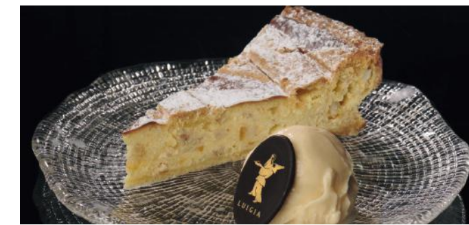
PASTIERA NAPOLETANA 11.00