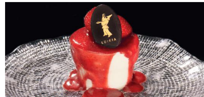
PANNA COTTA 9.00 Avec coulis de fraises