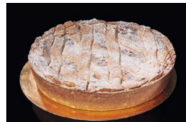
PASTIERA NAPOLETANA Pastiera Napolitaine