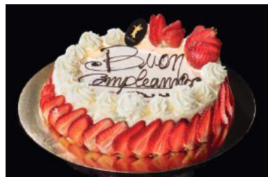
FRAGOLOSO Tiramisu aux fraises