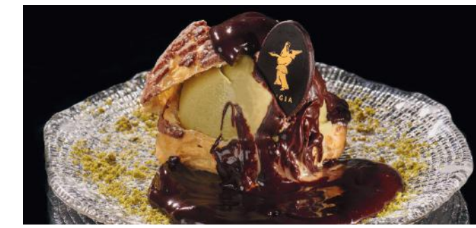
BRNTOLONE 11.00 Choux farci à la glace pistache de Bronte (provenance de la Sicile) et nappé de chocolat chaud