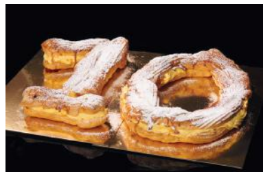
ZEPPOLA CARAMELATA Biscuit géant caramélisé à la forme d'un numéro