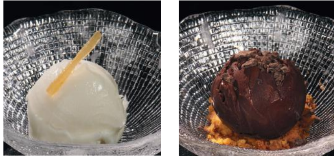
SORBETTO AL LIMONE (la boule) 6.00 GELATO ARTIGIANALE (la boule) 6.00 Glace artisanale posée sur un biscuit "di meliga" Demandez le parfum de votre choix au serveur