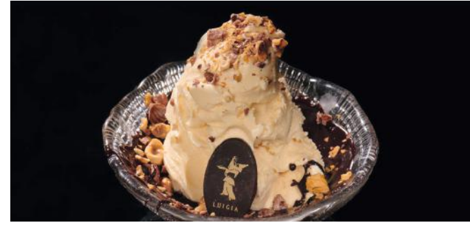
COPPA DELLA NONNA Glace maison à la crème 19.00 300g, noisettes caramélisées et chocolat (à partager)