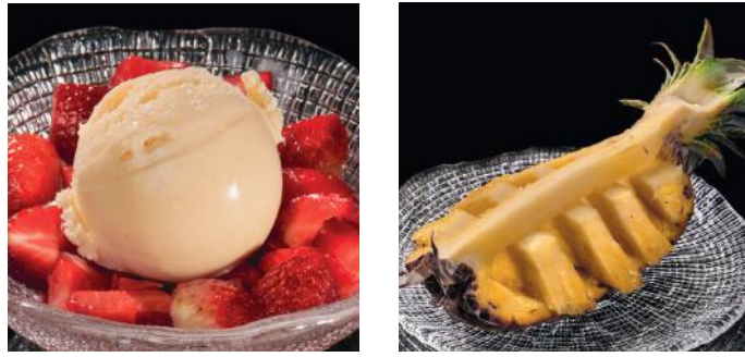
FRAGOLE CON GELATO Fraises avec de la glace 11.00 ANANAS FRAIS 9.00