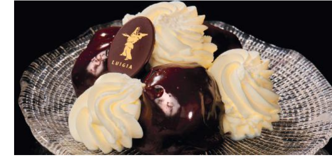
PROFITEROLES LUIGIA 11.00 Choux farcis avec la crème "Luigia" et nappé de chocolat