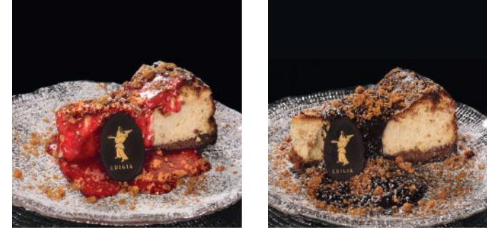
CHEESE CAKE LUIGIA 12.00 Avec coulis de fraise ou sauce au chocolat