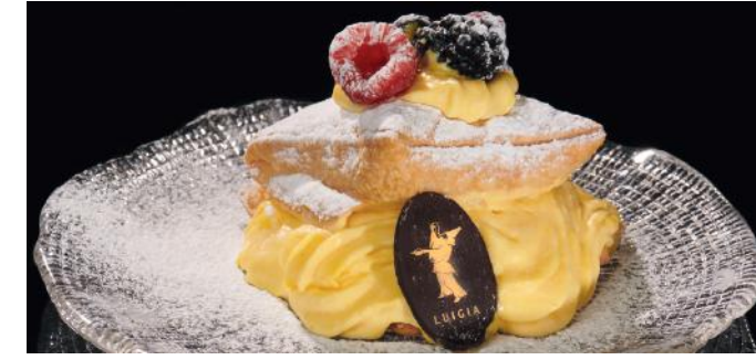
SPORCAMOUSS 9.00 Pâte feuilletée farcie à la crème Luigia et aux baies sauvages