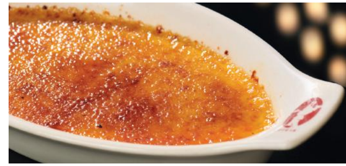
CRÈME BRULÉE 9.00