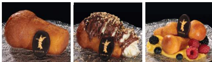
BABÀ TRADIZIONALE 9.00 Au Rhum BABÀ SPAZIALE 11.00 Au Rhum avec de la crème chantilly et du nutella MINI BABÀ 10.00 Avec de la crème et des baies sauvage