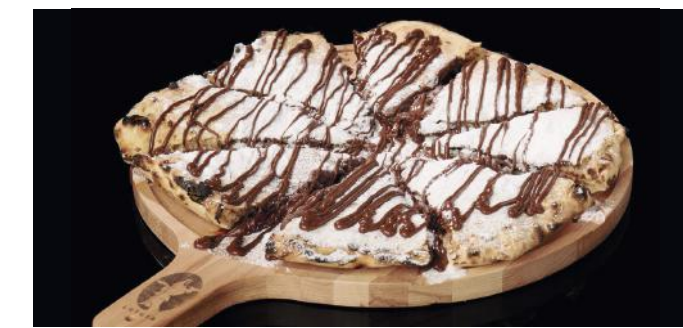
PIZZA ALLA NUTELLA Petite 15.00 Grande 25.00