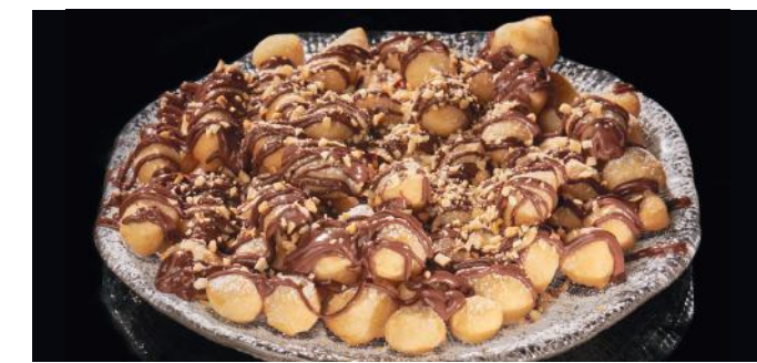
NUTELLINE 15.00 Beignets de pâte à pizza frits avec du Nutella et des noisettes