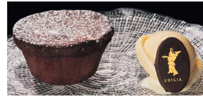
FONDANT AU CHOCOLAT 12.00 Avec glace maison à la crème et aux œufs